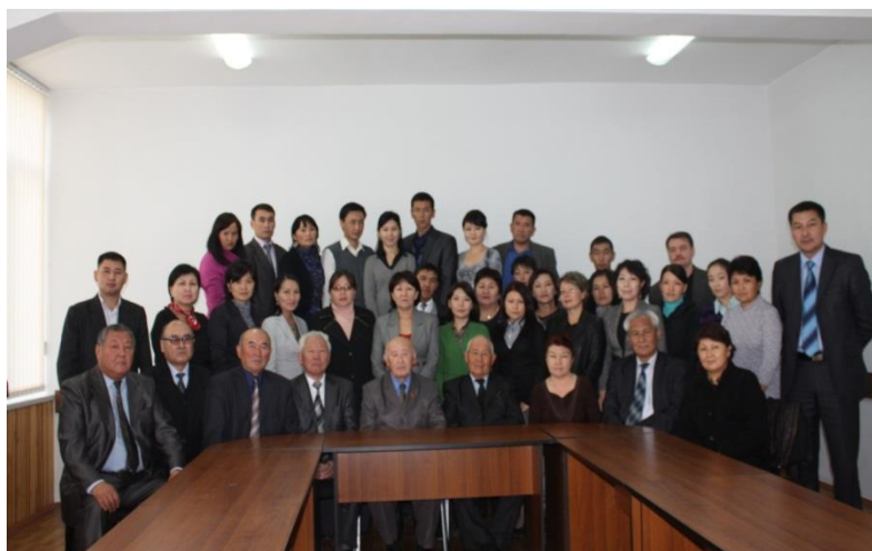
География, экология жана туризм факультетинин жамааты, факультеттин 75 жылдык маарекесинде (2014-ж).