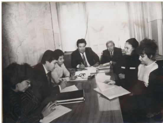
Экономикалык география кафедрасы жыйын өткөрүүдө (1988-ж).

окутуучулар жамааты өздүк салтын сактоо аракетинде болушкан. Натыйжада, факультет жөн эле сакталып калбастан, сапаттык жана сандык өсүштө болгон, ал жөнүндө калыс сандар күбө болот. Мисалы, 1937-жылы эки эле мугалим болсо, кийинки ар бир он жылдыкта алардын саны эселенип өсүп турган. Факультет өзүнүн дээрлик 85 жылдык эмгек жолунда өлкөнүн мектептери, илимий жана өндүрүштүк мекемелери үчүн 8000 ден ашык географ, эколог жана туризмолог адистерди даярдады. Алардын арасында көптөгөн көрүнүктүү окумуштуулар, ишмерлер, республиканын ардактуу мугалимдери, элге билим берүүнүн мыктылары бар. Республиканын жалпы билим берүүчү орто мектептеринин географ мугалимдеринин болжол менен 90 % жакыны биздин факультетти бүтүрүшкөндөр. Факультеттин, жалпы эле республикадагы география илиминин калыптанышына Ленинград менен Москванын окумуштуулары: С. Н. Резанцев, А.И. Ракитников, Б. А. Федорович, Н. Г. Гвоздецкий, Н. Т. Хрущев, С. Б. Лавров, С. А. Ковалев, Б. Н. Семейский, В. Г. Крючков, И. В. Никольский, Е. А. Слука, Ю. С. Фролов ж.б. чоң салым кошушту.