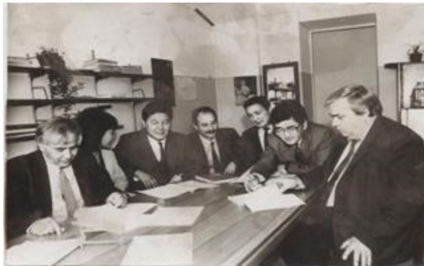
Геоморфология жана картография кафедрасынын жыйыны (1989-ж).

Факультеттин тарыхынын университеттик этабы кыргыз улутундагы көптөгөн мугалимдерди даярдоосу менен да даңктуу. Алар география боюнча сабактарды адистештирилген деңгээлде өткөрүү үчүн республиканын эң алыскы аймактарында да иштешкен.