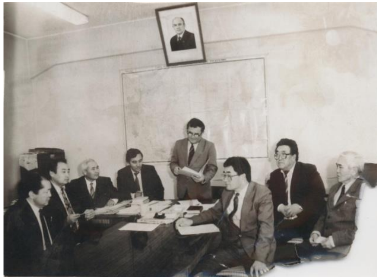
Геоморфология жана картография кафедрасынын жыйыны (1989-ж).