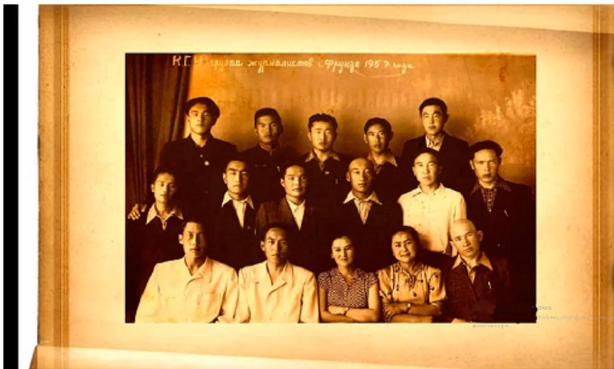
1971-жыл. Журналистика бөлүмү айрым объективдүү себептер менен жабылып калган.