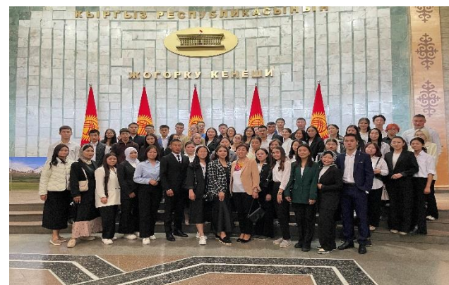
Экскурсия в ЖК КР, октябрь 2023 год