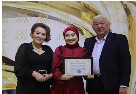
Благодарственное письмо родителям за успехи в учебе и общественных делах, декабрь 2021