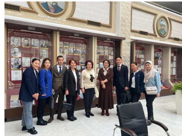
Наши студенты в ЕНУ, Казахстан по программе «Академической мобильности студентов», ноябрь 2023 г.