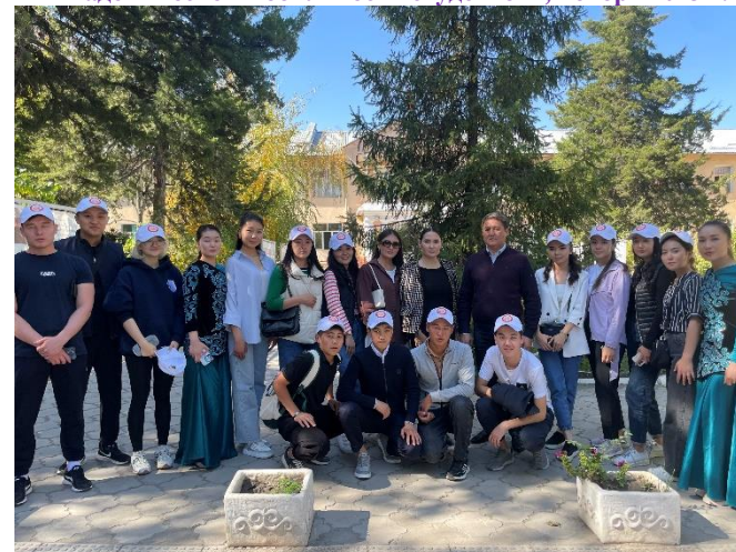
Студенты факультета в Доме престарелых, 2023 год