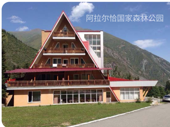
阿拉尔恰国家森林公园

学院拥有连续的多层次教育体系。学院根据《博洛尼亚教育体系》规定实施专业教育计划,由国内外一流教师参与,包括博士、副博士、教授和副教授。